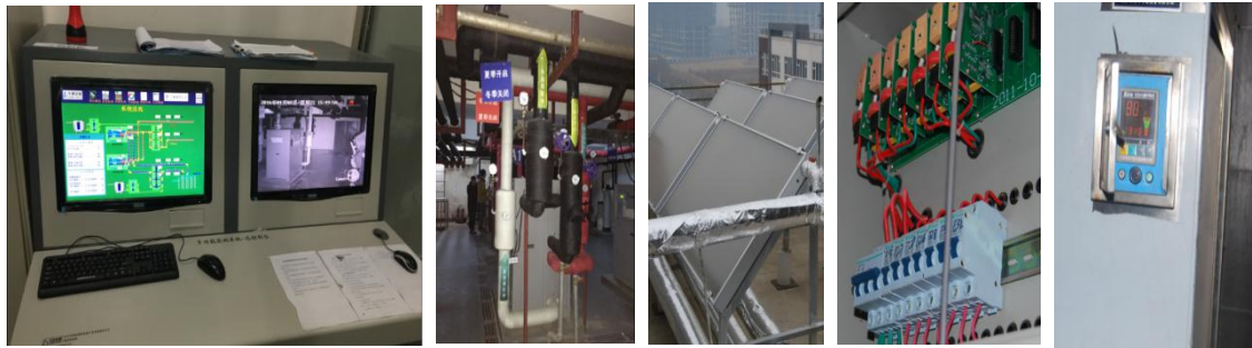
土壤源热泵监控系统与换热站

主要工作成效：近年来，团队在学术带头人带领下获吉林省科技进步二等奖 5 项、三等奖 1 项，省部级以上科研立项 30 余项，授权专利 20 余项，发表论文 210 余篇。